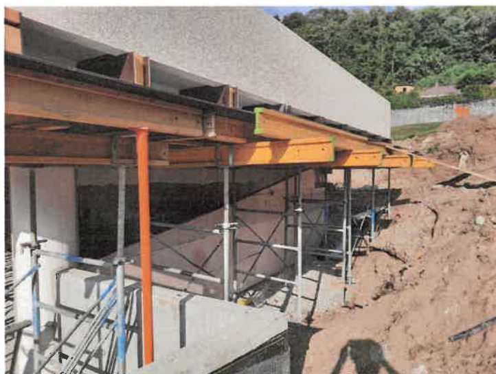
Travaux d'extension du groupe scolaire